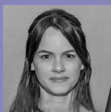
MARIANA PLUM PESQUISA E CONTEÚDO