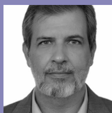
FELIPE SAMPAIO PROJETOS